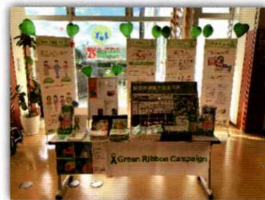
グリーンリボンキャンペーン